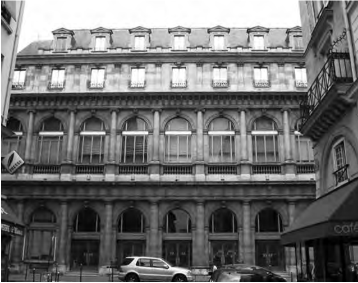
En la actualidad, el edificio del Théâtre Italien pertenece al Banco Central Francés.

tabile Sogno soave e casto y el allegro que le sigue, Mi fa il destin mendico (Acto I, escena III), no son otra cosa que un aria y cabaletta de Ernesto, intervenida por los comentarios de Don Pasquale. Este momento ofrece el contraste entre lo lírico y lo cómico expresados en simultaneidad. Entre los recursos innovadores destacamos la manera de tratar los recitativos, secchi en su estilo, pero desarrollados sobre la base de los acordes de la orquesta en lugar del settecentesco clavicembalo .