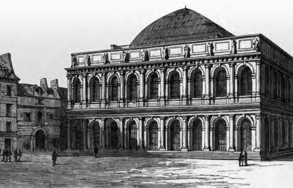
El Théâtre-Italien (Sala Ventadour), lugar del estreno de Don Pasquale .

aquellos años no fue París la única ciudad extranjera en la que Donizetti obtuvo reconocimiento.