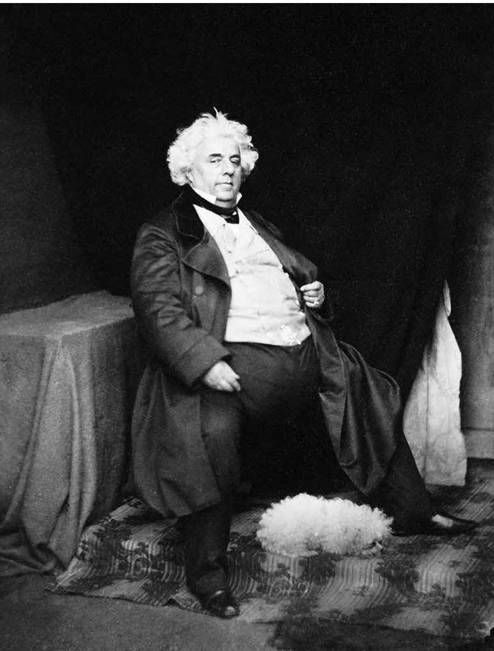
Luigi Lablache, creador de Don Pasquale. (Daguerrotipo tomado en 1856 por Caldesi y Montecchi)

estrenos donizettianos. Tras una interrupción en los ensayos por enfermedad de Mario y Tamburini, la ópera se estrenó el 3 de enero de 1843. El triunfo fue inmediato y el altísimo nivel del suceso fue comparado con el de I puritani de Bellini, estrenada 8 años antes también en el Italien, con la participación de Grisi, Tamburini y Lablache (el tenor en aquella oportunidad fue Giovanbattista Rubini). Así evocó Donizetti el estreno de Don Pasquale : “El éxito fue de los más felices. Se repitió el adagio del final del segundo acto. Se repitió la stretta del duetto entre Lablache y Grisi. Fui llamado al fin del segundo acto y del tercero. No hubo momento, de la sinfonía en adelante, que no haya sido aplaudido. Estoy muy contento.” Sí, al cabo de algunos años de espera, el compositor disfrutaba del triunfo parisiense tan anhelado.