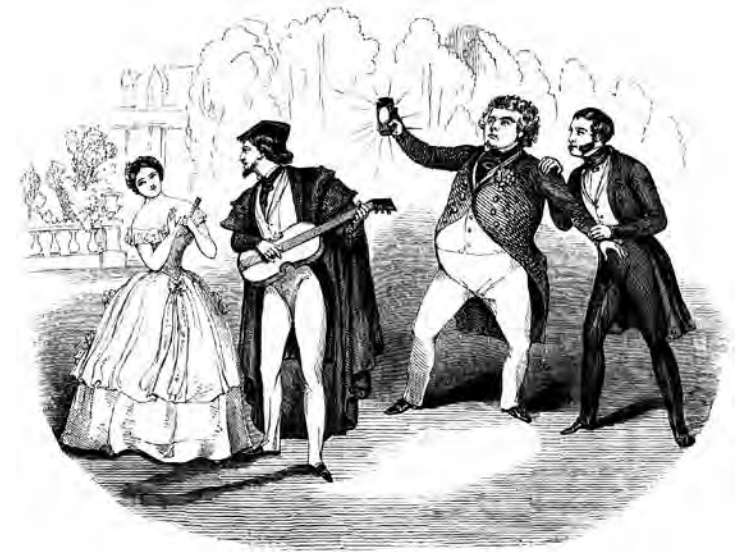
Los primeros intérpretes de Don Pasquale , aquí durante la última escena en ocasión del estreno londinense.