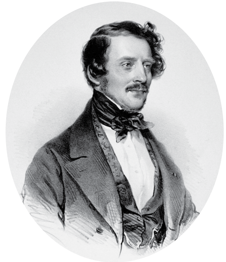
Gaetano Donizetti en 1842, año de su llegada a Viena. (Retrato de Kriehuber)