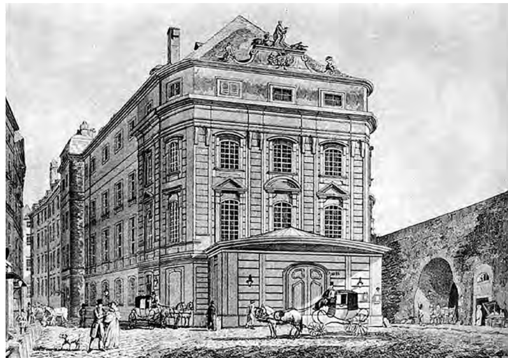
El Kärntnertheater de Viena, donde se estrenó Linda di Chamounix . (Imagen de 1830)

Es acostumbrado repetir que Don Pasquale fue escrita ni más ni menos que en 11 días, pero no es bueno persistir en semejante malentendido. Se puede establecer ese período como el necesario para el esbozo de la partitura, que a su vez, como se verá más adelante, incorporó música preexistente. La orquestación se realizó por