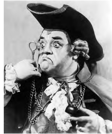
Salvatore Baccaloni, Don Pasquale en Buenos Aires durante las temporadas 1930, 1932 y 1941 del Teatro Colón. (Aquí, como Bartolo)

La noche, la naturaleza, el viejo burlado, la reconciliación, la unión de los jóvenes amantes y la moraleja final, que sentencia que un viejo que decide casarse está loco y no conseguirá más que proble-