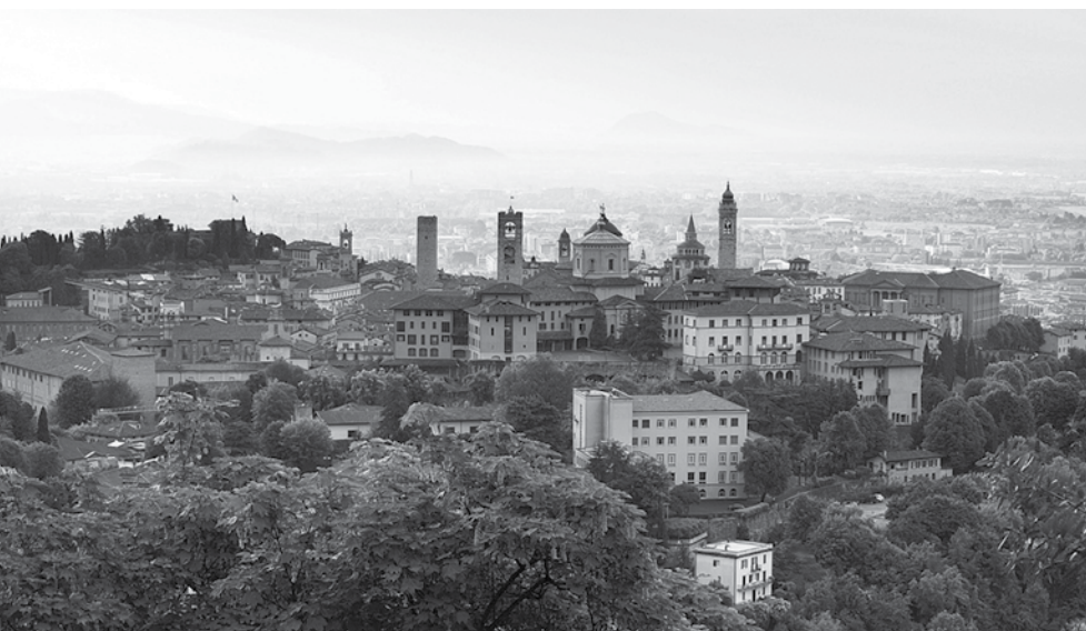
Vista actual del casco histórico de Bérgamo, ciudad natal de Donizetti.

Italien, que además pasaron a la historia entre los más célebres cantantes del siglo XIX: Giulia Grisi, Antonio Tamburini, Luigi Lablache (con estos lo unía una relación de muchos años) y Mario, nombre artístico del noble nacido en Cerdeña Giovanni Matteo de Candia; si bien este no le era desconocido, no lo ligaba tanta experiencia en común como con los demás.