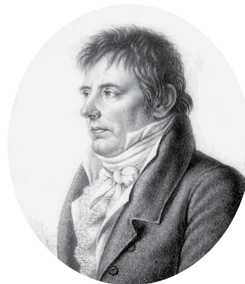
El compositor alemán Johann Simon Mayr, maestro de Donizetti.

Las innovaciones no solo consistieron en situar la acción en época contemporánea, idea que por contraste acentúa la personalidad anticuada de Don Pasquale, ceremonioso y tan entrado en años