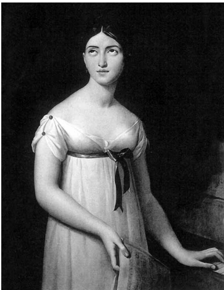
Giuditta Pasta, creadora de Anna Bolena.

a la gestión de la otra sala y para conseguir su fin planearon una temporada de gran calidad. Le ofrecieron al compositor el privilegio de inaugurar la estación de Carnaval, una compañía de cantantes que incluía a celebridades como Giuditta Pasta, Rubini y Filippo Galli (el bajo que creó el papel de Mustafâ en L'italiana in Algeri entre otros personajes rossinianos), un libreto de Felice Romani y la atractiva suma de 650 escudos. El tema elegido giraba en torno a la figura de Ana Bolena, la segunda y desgraciada esposa del monarca británico Enrique VIII, tema que a su vez introdujo a Donizetti en el mundo de sus tres reinas Tudor. (Siguieron Maria Stuarda –Scala, 1835, libreto