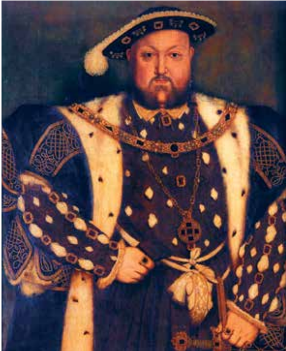
Enrique VIII, por Hans Holbein el Joven.

Los autores sitúan la acción en Londres y Windsor, en la corte del rey Enrique VIII, hacia 1536.