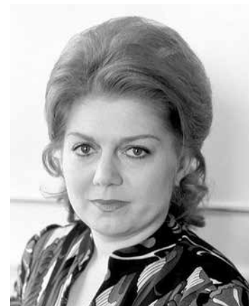
Elena Suliotis, Anna Bolena en la única producción ofrecida en el Teatro Colón (1970).