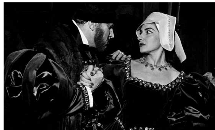
Maria Callas (Anna) junto a Nicola Rossi-Lemeni (Enrico), en la producción de Luchino Visconti para el Teatro Alla Scala (Milán, 1957).

Gracias a la calidad del libreto, que le proporcionó un argumento romántico con dos amantes que se preparan a morir mientras anhelan un más allá que los libere de los sufrimientos terrenales, Donizetti penetró en una era nueva en la que el obligado lieto fine comenzaba a ser patrimonio del pasado, y en la que pudo desplegar ese pathos que distingue a tantas de sus creaciones futuras. Con la preocupación de crear un drama capaz de cautivar al público, donde nuevos procedimientos conviven con aspectos convencionales, entre los aciertos no deja de hacerse hincapié en el célebre final. Grande y patético, lleva sobre sí toda la carga emocional y musical de la obra, y, distante de los finales tradicionales, corona el devenir de la acción teatral con una maestría que siempre ha sido causa de ferviente admiración. Aúna aspectos de las arias de locura y de muerte y pone a prueba a la soprano, que gracias a tan extraordinario momento le es servida la posibilidad de exhibir sus dotes vocales y actorales. Podemos decir que con su herencia clásica, Anna Bolena marca la culminación de un largo proceso que deriva en la consagración del compositor y lo coloca en el escenario de la tragedia romántica.