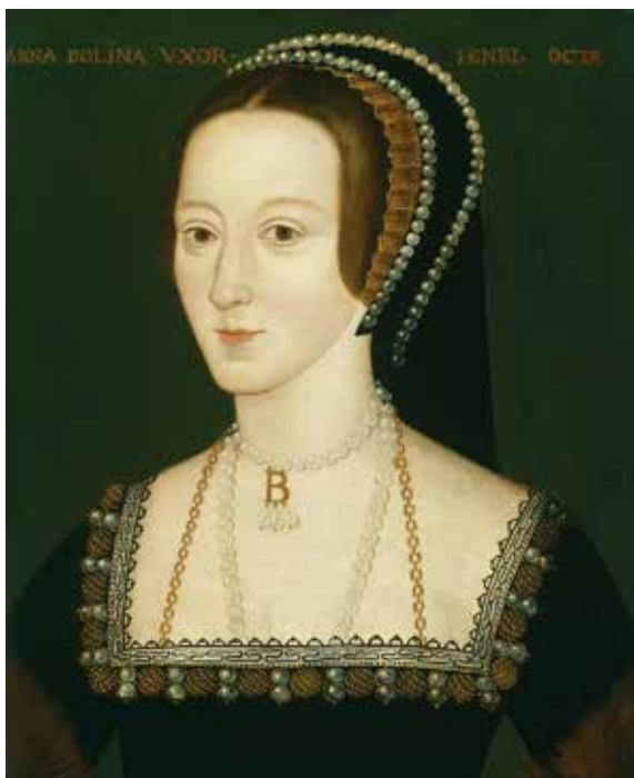
Ana Bolena (autor anónimo)

cual ella fue a su vez dama de compañía y amiga. Aparece Giovanna y le implora que se confiese culpable: solo de esa manera se podrá divorciar de Enrico y salvará su vida. Anna rechaza la propuesta y el llanto de su dama revela la verdad: ella es la amante del Rey. Giovanna implora perdón a la reina, quien se lo concede.