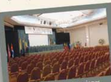
Gran Salón de convenciones