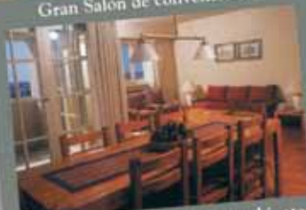
Departamentos de 2, 3 y 4 ambientes