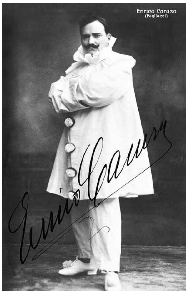
Enrico Caruso como Canio