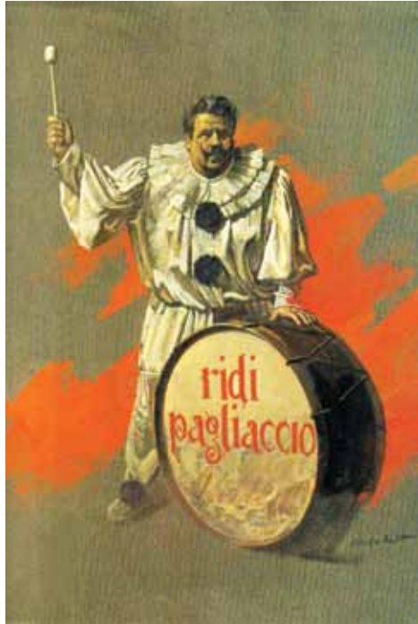
Ruggero Leoncavallo en una ilustración que lo muestra como Pagliaccio

(Canio), espera a Arlequín, interpretado por Beppe, quien le canta una serenata. Llega Tonio convertido en Taddeo, un sirviente viejo y contrahecho que hace reír al público, cuando le declara su amor a Colombina. Ella lo rechaza, se queda con Arlequín y Taddeo se retira, para regresar y anunciar la llegada de Pagliaccio. La situación que se produce recuerda a Canio lo vivido por la tarde y, tratando de contenerse, quiere proseguir con la actuación. Pero no lo consigue, pues el teatro se mezcla con la realidad y comienza a insultar a su mujer para que le revele el nombre del amante. Ante la interpretación tan realista el público se entusiasma y aplaude. Nedda trata de mantenerse en el personaje de Colombina, cada vez que Canio le pregunta el nombre responde “Pagliaccio”, pero la comedia ya es insostenible. El actor se enfurece y, ciego de rabia y dolor, apuñala a su mujer. Silvio se lanza sobre la amante y también recibe una puñalada mortal. Canio arroja el arma al piso y contempla la escena estupefacto. Por último, se le anuncia al horrorizado público que la comedia ha terminado. ■