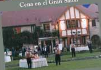
Villa Gainza Paz