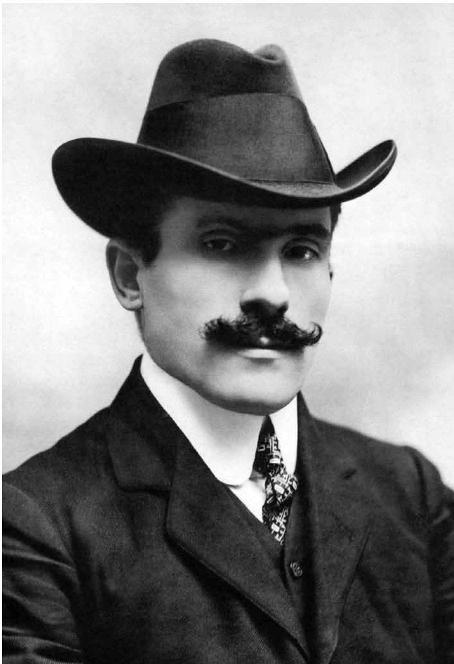
Arturo Toscanini, director del estreno mundial de Pagliacci

pero no le pudo haber tocado peor suerte que competir con la de su colega; sabemos que la de Puccini es la ópera más representada y exitosa de todos los tiempos.