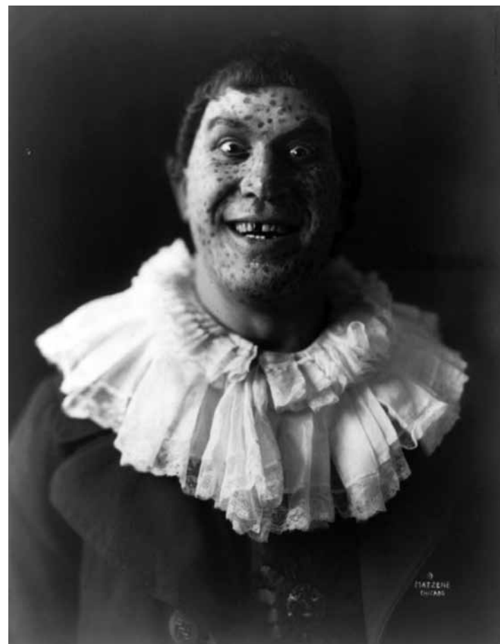
Titta Ruffo como Tonio