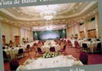
Cena en el Gran Salón