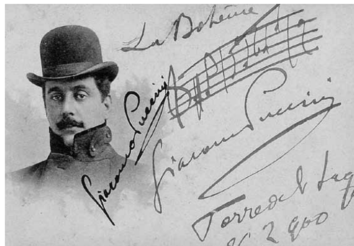
Autógrafo musical de Giacomo Puccini