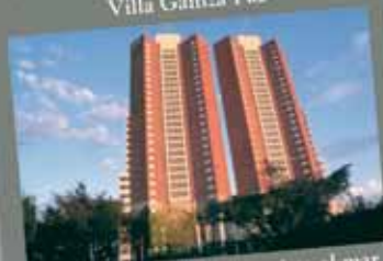
190 departamentos con vista al mar