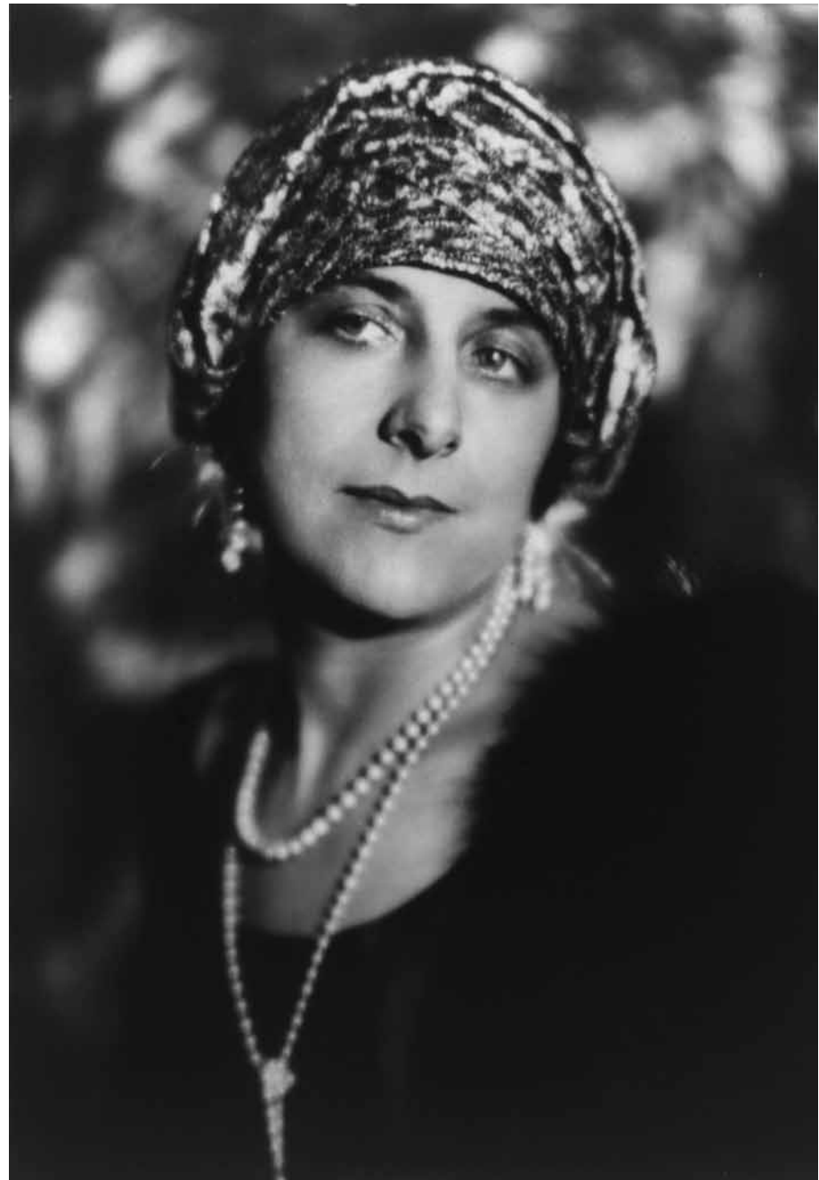
Geraldine Farrar, primera intérprete de Suor Angelica en el estreno mundial

Inicialmente se pensó en estrenar Il trittico en Roma, pero la falta de artistas (la Primera Guerra Mundial entraba en su recta final y muchos de ellos aún luchaban en el frente) hizo cambiar los planes.