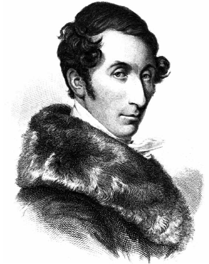
Carl Maria von Weber