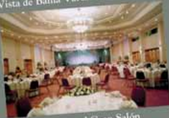
Cena en el Gran Salón