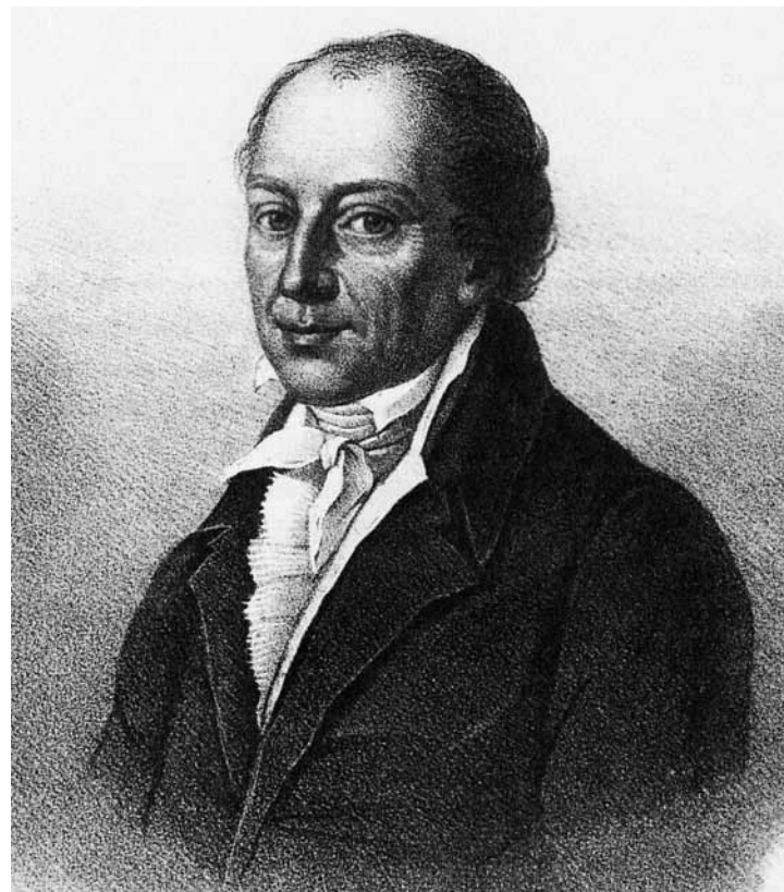
Friedrich Kind por M. Knädig.

A la noche, en la casa de Kuno. El retrato del fundador de la familia ha caído de la pared e hirió la frente de Agathe. La joven ve una mala