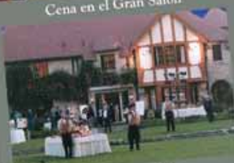
Villa Gainza Paz