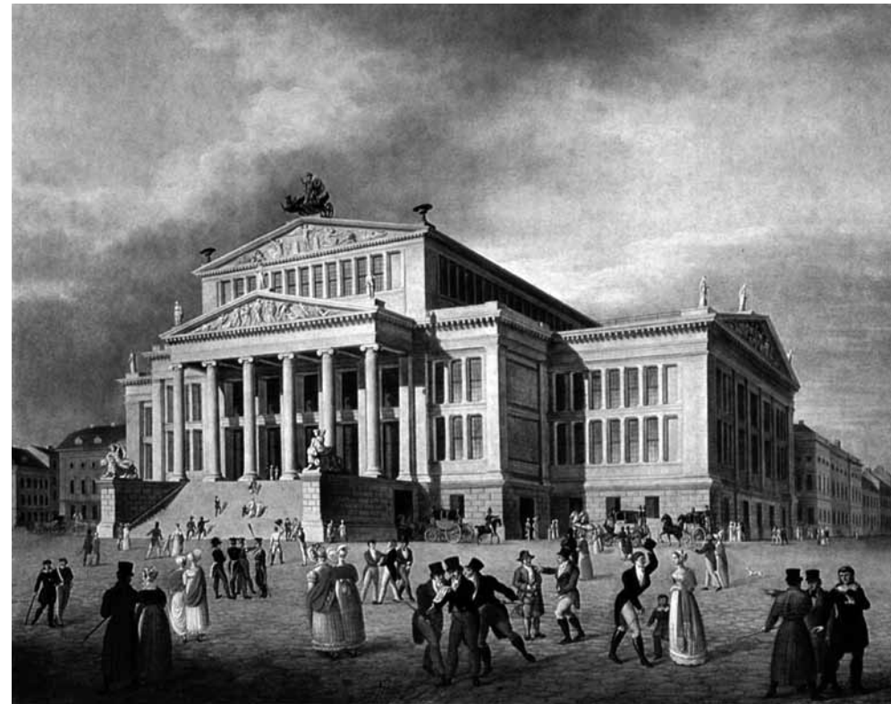
El Königlich Schauspielhaus de Berlín, lugar del estreno de Der Freischütz , en una imagen de la época.

“(…) existen dos elementos principales que pueden observarse desde el primer momento: la vida del cazador y el dominio de los poderes demoníacos personificados en Samiel. Así que cuando compuse esta obra tuve que buscar