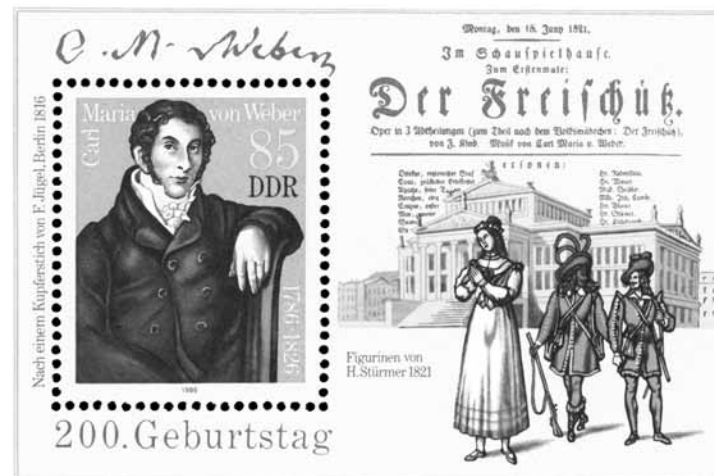
Sello postal en homenaje a Der Freischütz .

Por último, aclaremos que Der Freischütz es un nombre casi imposible de traducir a nuestra lengua. Se optó por llamarla El cazador furtivo , pero la idea del término en alemán lleva a pensar en un cazador que utiliza balas infalibles, mágicas. La leyenda de las balas mágicas se remonta al siglo XVI y se sabe del empleo del