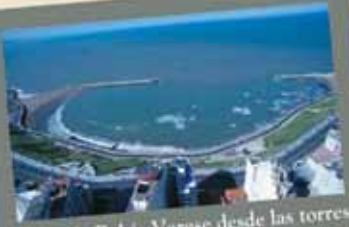
Vista de Bahía Varese desde las torres

En Mar del Plata, Torres de Manantiales es la opción más completa para realizar eventos empresarios y sociales, permitiendo lograr una integración entre el placer y los negocios. Su Centro de Convenciones posee doce salones que permiten articular múltiples actividades. Desde el Gran Salón Manantiales para 1.000 personas hasta los versátiles salones intermedios ideales para juntas de negocios, y la clásica residencia Villa Gainza Paz con sus atractivos espacios múltiples. Manantiales cuenta con 190 amplios departamentos con una maravillosa vista panorámica de la costa atlántica. Completan las facilidades operativas Manantiales Club de Mar y su playa privada, que se adecua como un ambiente ideal para jornadas de integración, motivación e incentivo.