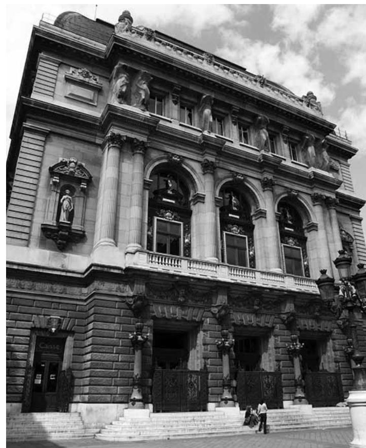
La Opéra-Comique de París (Salle Favart), lugar del estreno de Carmen