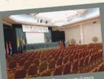
Gran Salón de convenciones