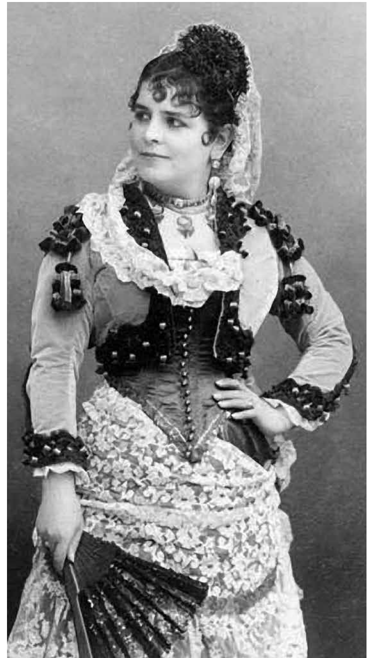
Marie Célestine Galli-Marié, primera intérprete de Carmen

Se puede resumir la labor de Guiraud de la siguiente manera. Éste introdujo en la partitura de Carmen 654 nuevos compases: 365 repartidos a lo largo de 15 recitativos con acompañamiento de orquesta, 289 para tres movimientos de danza colocados entre los números 25 y 26 del acto IV. El primer movimiento está basado en el número 19 de su música escénica para L'Arlessienne de Daudet; el segundo es una reelaboración del número 2 de la obra nombrada, y el tercero parte de la Danse bohémienne de La jolie fille de Perth . Además de estos agregados quitó 208 compases de música original, como el couplet completo del número 2, parte del duelo entre Don José y Escamillo y el postludio para coro del número 25. Tampoco dejó de retocar la instrumentación (en especial los cornos del dueto del número 7 y del comienzo del número