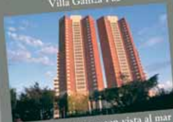
190 departamentos con vista al mar