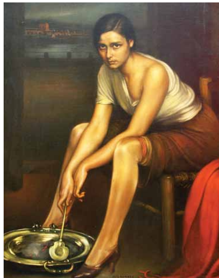
Julio Romero de Torres: La chiquita piconera .

Zúñiga y otros militares están en compañía de las gitanas Mercedes y Frasquita, dos amigas de Carmen. Ésta se entera de que Don José, encarcelado por culpa de ella, ha salido de prisión. En medio del furor entra el torero Escamillo, quien es invitado a beber con los soldados. El torero corteja a Carmen pero ella se muestra indiferente. Cuando los hombres salen y dejan solas a las tres mujeres, se acercan el Dancairo y el Remendado, dos contrabandistas,