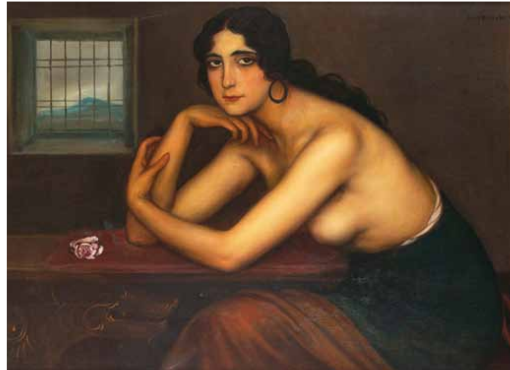
Julio Romero de Torres: Carmen de Córdoba