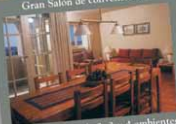
Departamentos de 2, 3 y 4 ambientes