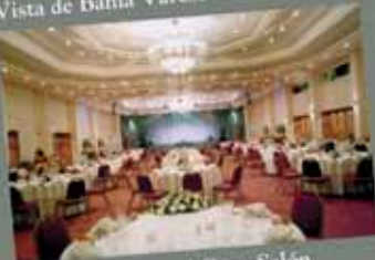
Cena en el Gran Salón