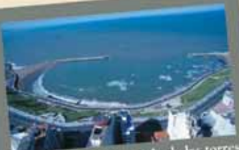
Vista de Bahía Varese desde las torres

En Mar del Plata, Torres de Manantiales es la opción más completa para realizar eventos empresarios y sociales, permitiendo lograr una integración entre el placer y los negocios. Su Centro de Convenciones posee doce salones que permiten articular múltiples actividades. Desde el Gran Salón Manantiales para 1.000 personas hasta los versátiles salones intermedios ideales para juntas de negocios, y la clásica residencia Villa Gainza Paz con sus atractivos espacios múltiples. Manantiales cuenta con 190 amplios departamentos con una maravillosa vista panorámica de la costa atlántica. Completan las facilidades operativas Manantiales Club de Mar y su playa privada, que se adecua como un ambiente ideal para jornadas de integración, motivación e incentivo.