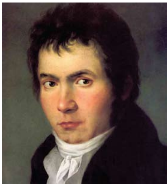
Ludwig van Beethoven en la época de Fidelio

del rey que inspeccionará la prisión, para comprobar si es cierto que allí hay hombres que fueron detenidos de manera ilegal. Antes de que sea tarde decide el asesinato de Florestan, su desgraciado enemigo político. Como Rocco se niega a ser cómplice, Don Pizarro decide llevar a cabo él mismo el crimen luego de que algún empleado de la cárcel haya cavado la fosa para el cadáver. Leonore escucha la conversación y aunque no sabe si se trata de su marido, se desespera. Don Pizarro se retira. Le pide a Rocco que abra las celdas para que los presos puedan salir al patio. El carcelero accede. Florestan no está entre los emocionados presos encandilados por la luz del día, a la que no ven desde hace mucho. Regresa Don Pizarro. Accede al pedido de que Leonore acompañe a Rocco a ver al prisionero, pero se enfurece al ver a los reclusos en el lugar. Rocco aplaca los ánimos y hace mención de la llegada de la primavera y del cumpleaños del rey.