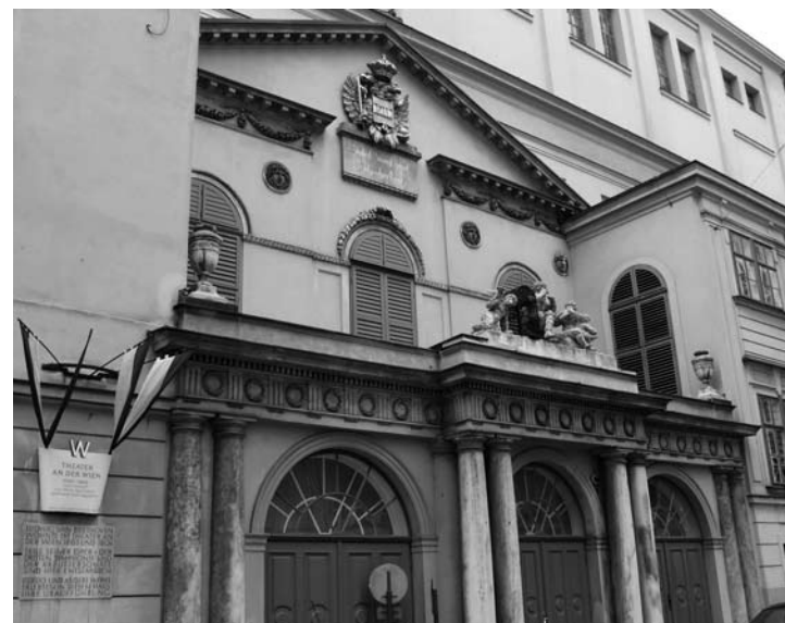
La "Puerta de Papageno" del Theater an der Wien de Viena, donde se estrenó Fidelio en 1805.

Al año siguiente del estreno de Lodoïska , Schikaneder le encargó a Beethoven la composición de una ópera para el Theater an der Wien. Le armó un departamento en el teatro para que trabajase en paz y puso a su disposición un libreto de su autoría titulado Vestas Feuer ( El fuego de Vesta ). Beethoven no experimentó mucho entusiasmo y cuando estuvo a punto de abandonar la idea de componer para la escena lírica, el teatro cambió de dueño y el nuevo administrador, Joseph Ferdinand Sonnleithner, le propuso que compusiese su ópera sobre el texto mencionado líneas arriba: Léonore ou l'amour conjugal , de Jean-Nicolas Bouilly, un tema tan conocido como exitoso. Atrás quedó la idea de