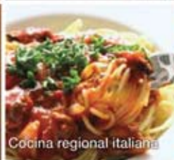
Cocina regional italiana