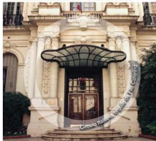
Circolo Italiano Orgalla del Filo Catering