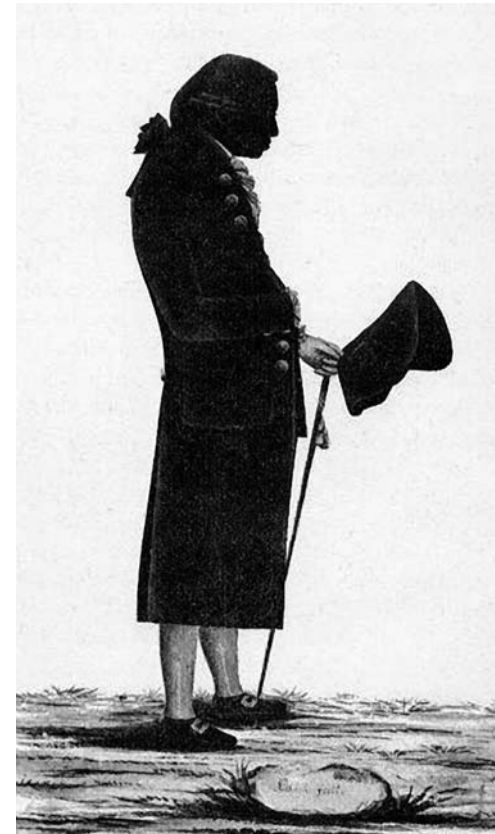
Silueta de Immanuel Kant

Ludwig van Beethoven (Bonn, 1770 - Viena, 1827) nació en la ciudad de residencia del Elector de Colonia, Maximiliano Francisco,