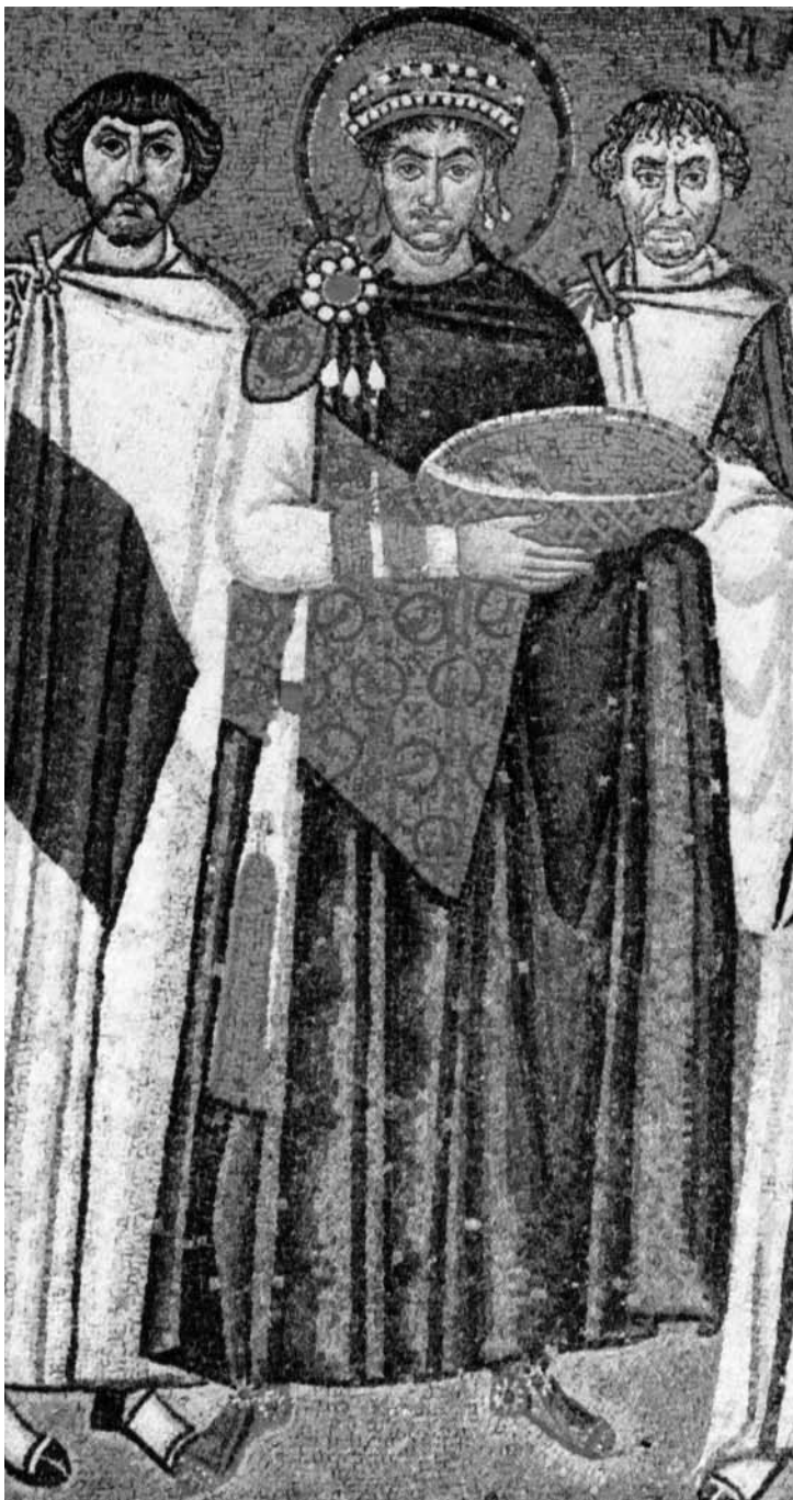
El emperador Giustiniano (detalle del mosaico en su honor, San Vitale de Ravenna; a su diestra: Belisario)

ofrecido por los ostrogodos. Luego perdió el favor del emperador, regresó a Bizancio y nuevas campañas lo devolvieron a Italia. Establecido definitivamente en Constantinopla, obtuvo victorias sobre los búlgaros y los hunos. Esto último fue en 559, tras lo cual fue acusado de conspiración contra Giustiniano, encarcelado y privado de sus bienes. Se lo absolvió en 563 y falleció dos años más tarde. Hasta aquí el resumen de la figura histórica.