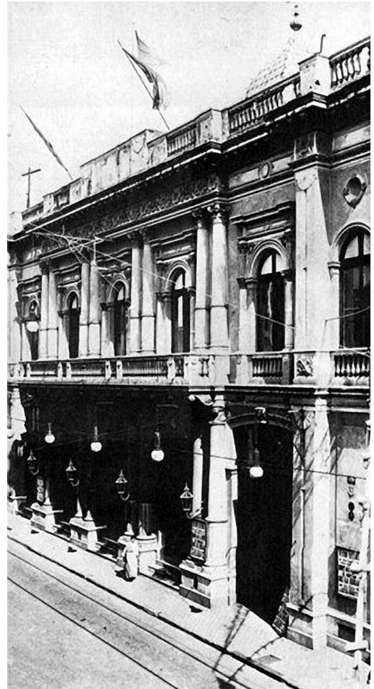
El Teatro de la Victoria