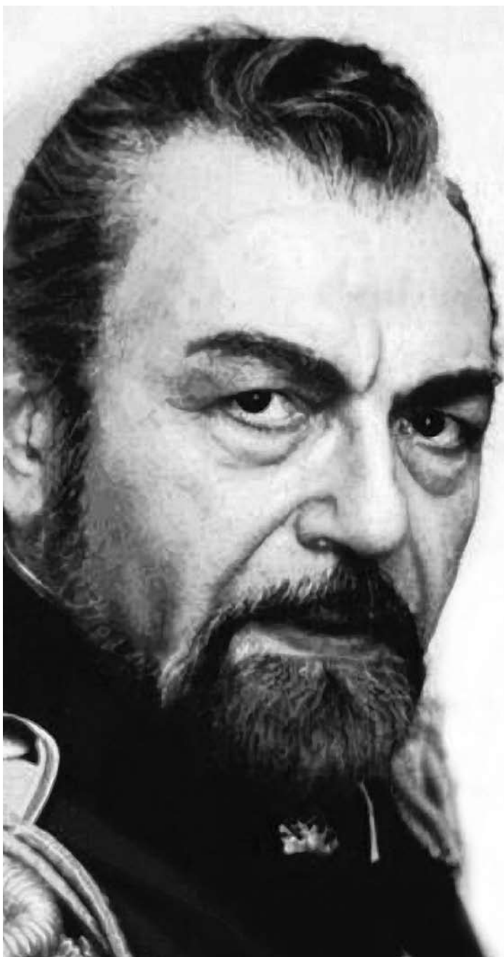
Renato Bruson, intérprete de Belisario en la exhumación argentina de 1981 (Teatro Colón)