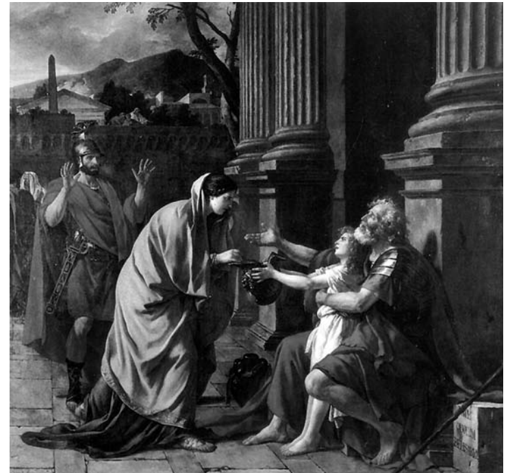
Belisario , por David (1781, Museo de Bellas Artes de Lille)