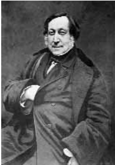
Gioachino Rossini retratado por Nadar.