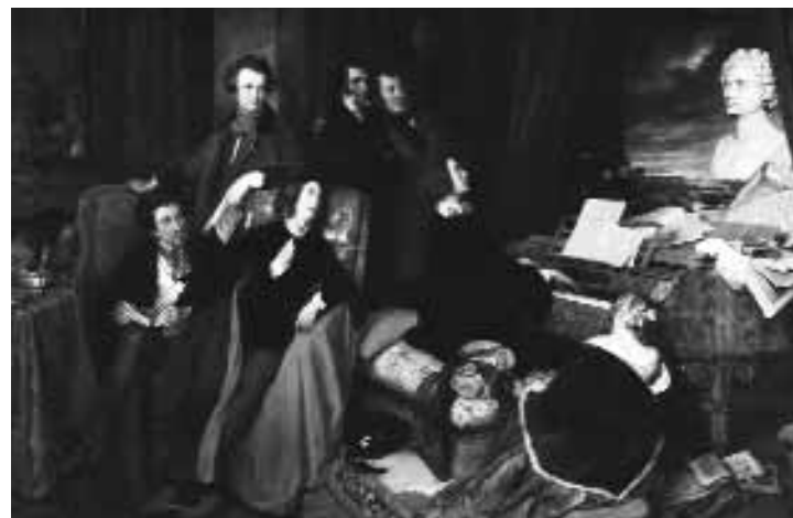
Una velada musical en París imaginada por Joseph Dannhauser hacia 1840. De izquierda a derecha: (parados) Victor Hugo, Niccolò Paganini y Gioachino Rossini; (sentados) Alexandre Dumas –padre– y George Sand. Al piano: Franz Liszt. Sentada junto a él y de espaldas: la condesa Marie D'Agoult. Desde el piano vigila Beethoven, y desde la pared, Lord Byron.

El éxito de L'italiana in Algeri fue arrollador y Stendhal, rosiniiano de la primera hora, recordaba que "jamás una ciudad ( Venecia ) había gozado tanto de un espectáculo tan afin a su carácter". Para el compositor, gestar la nueva ópera fue en cierto modo un entretenimiento. Los reiterados bises y estruendosas ovaciones con que fue recibida lo desconcerta-